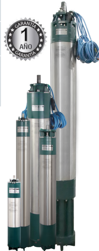
MOTORES SUMERGIBLES REBOBINABLES DE 6", 8", 10" Y 12" (60hz, 2 polos, 3450rpm)